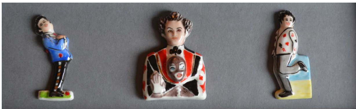
Coffret série B – décors uniques, numérotation de 1 à 35, signature au dos des fèves et sur le coffret