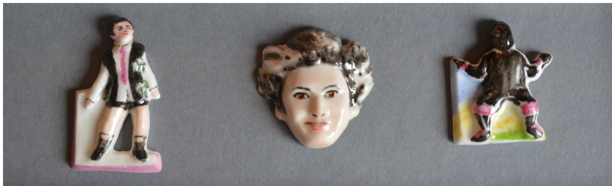
Coffret série A – décors uniques, numérotation de 1 à 35, signature au dos des fèves et sur le coffret