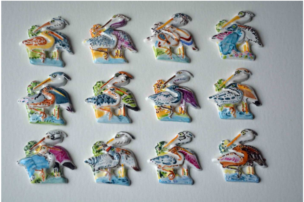
Extrait de la série « Hérons », 180 fèves pour la Glass Vallée en Baie de Somme